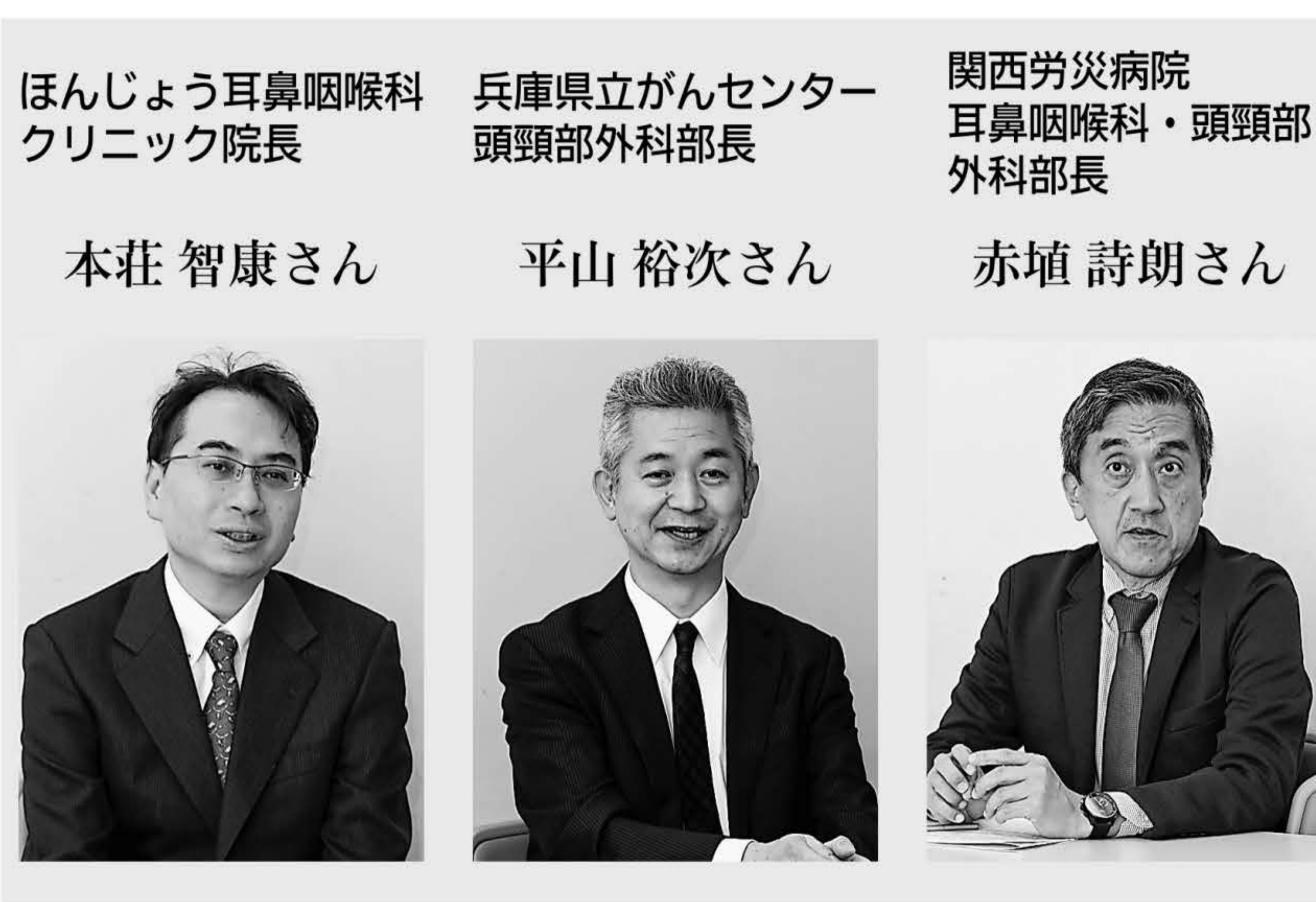
ほんじょう耳鼻咽喉科クリニック院長

頭頸部がんは、これらの部位にできるがんの総称。頭頸部は人の五感のうち、嗅覚、聴覚、味覚が集まり、咀嚼・嚥下、呼吸も担う器官もある。頭頸部がんは、これらの部位にできるがんの総称。